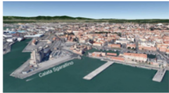
Porto di Livorno 2000 - Terminal Crociere